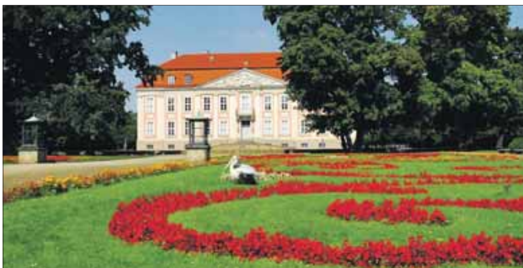
Im Schloss finden neben Ausstellungen und Konzerten auch Hochzeiten statt.

Im Festsaal des Schlosses erklingt ein Flügel und im Gartensaal ein Cembalo. Zum Tête-à-Tête in königlicher Atmosphäre lädt das Schlosscafé.