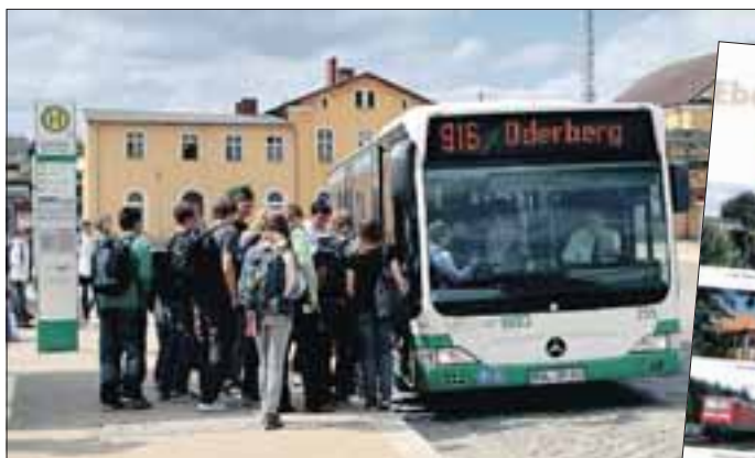
Seit 2008 befindet sich der Busbahnhof direkt vor dem Bahnhofseingang.

In Zusammenarbeit mit dem Landkreis hat die Barnimer Busgesellschaft (BBG) des Busnetz für Eberswalde und Umgebung zum 1. September optimiert. Auch Besucher der Region, die mit dem RE 3 von Berlin aus anreisen, profitieren davon. Der Verkehrsverbund Berlin-Brandenburg (VBB) informiert nun in einem neuen Flyer über die Angebote in den VBB-Infoblättern „Eberswalde Stadtverkehr“ und „Eberswalde Regionalverkehr“. Darin finden sich jeweils ein übersichtlicher Liniennetzplan, die genauen Fahrpläne der Buslinien und der Regionalzüge nach Berlin sowie einige Fahrpreisbeispiele.