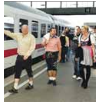
Gute Laune schon am, später garantiert im Partyzug

Der Reisepreis ab Berlin inklusive Hin- und Rückfahrt in der 2. Klasse des Sonderzuges, Sitzplatzreservierung und Reiseleitung beträgt 75 Euro, ab Potsdam und Belzig 73 Euro.