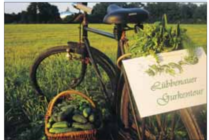
Rumgurken in und um Lübbenau

Tickets ☎ (0 35 42) 22 25 oder www.spreewaelder-lichtnaechte.de