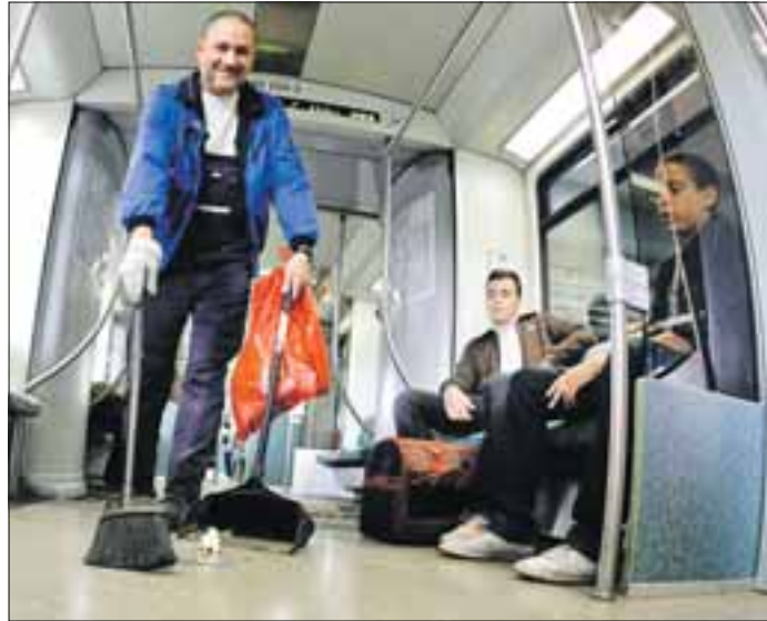
Auch unterwegs werden die Züge von Müll und Schmutz befreit

Verunreinigungen generell genommen haben. Jedoch war der Reinigungsaufwand in den letzten Monaten aufgrund des reduzierten Fahrplanangebotes in den eingesetzten Zügen, die intensiver genutzt wurden, auch höher. In der jüngsten Kundenzufriedenheitsbefragung vom Frühjahr erhielt die S-Bahn Berlin schlechtere Noten für die Sauberkeit. Rühmann: „Von 2,6 sind wir auf die Note 2,8 abgerutscht.“ Das Bewertungssystem ist dabei analog zu dem der Schulnoten. „Wir nehmen die Sache ernst und wollen mit guter Arbeit überzeugen. Dazu gehört es, Schwachstellen zu erkennen und zu beheben“, umreißt der „Reinigungsmanager“ die Herausforderung.