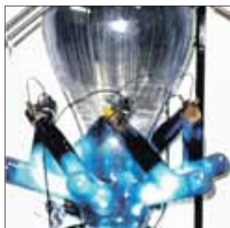
Der Gleichrichter macht aus Drehstrom Gleichstrom.

Sammlerstücke und Dokumentationen stehen zum Erwerb bereit. Für Getränke und Imbiss ist ebenfalls gesorgt.