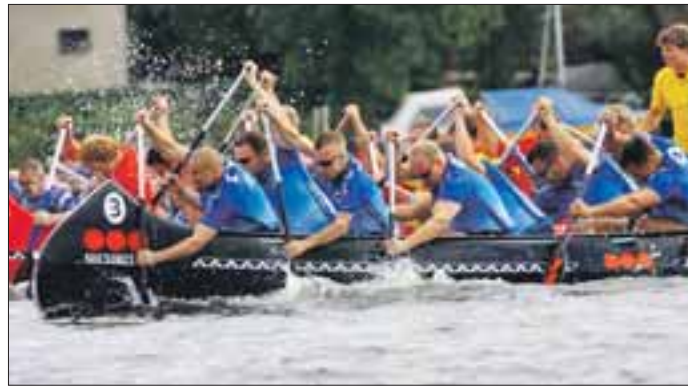
Spannende Wettkämpfe auf dem Templiner See bei Potsdam