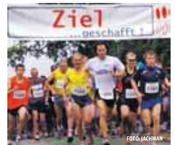
Start für die mittleren Distanzen über 6 und 10 km im vergangenen Jahr.

Auch Wanderer, Walker und Nordic-Walker können teilnehmen, außer am Marathon. Die Startgebühren betragen beim Marathon 25 €, Halbmarathon 12 €, 10 km 10 €, 6 km 8 €, Kinderlauf 2 €, unter 13 Jahren gebührenfrei. • mpj