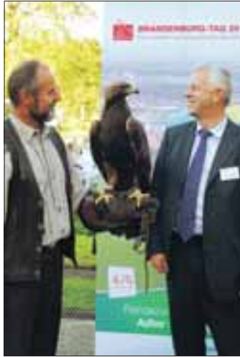
Rendezvous mit dem Wappentier, rechts Bürgermeister Polzehl

Jürgen Polzehl: Viel besser als mancher denkt! Schwedt/Oder ist das Tor zum Nationalpark Unteres Odertal - einer der letzten naturnahen Flussauenlandschaften Mitteleuropas. Naturschauspiele wie der Tanz der Kraniche im Herbst oder der Gesang der Schwäne im Winter locken viele Gäste von überall her in die Region. Eine