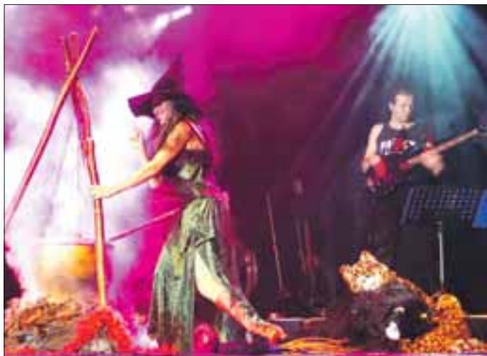
Poppige Rockoper nach berühmtem Drama

Das ist Anlass für die brandenburgische Landesarbeitsgemeinschaft für darstellendes Spiel in den Schulen (e.V.), diese Rockoper im Rahmen des MusikTheatertages der Schulen am 8. September 2010 in einer eigenen Schülerveranstaltung in der Potsdamer Waschhaus-Arena zu präsentieren. Unterstützt wird sie dabei von