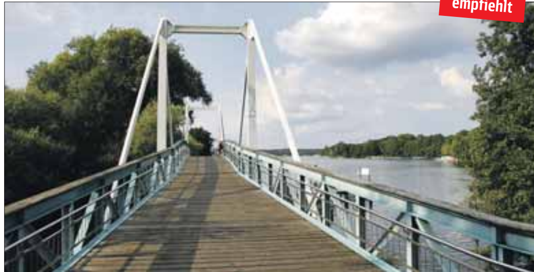
Spandau: Brücke über den Teufelsseekanal

An der Wasserstadt Spandau vorbei schwenkt der Weg nach Norden und vereint sich entlang der Havel zunächst mit dem Havelradweg und später mit dem Mauerweg. Rechter Hand gleitet der Blick über die Havel zum Reinickendorfer Stadtteil Konradshöhe. Aber aufgepasst bei der Querung der kühn gezackten Brücke über den Teufelsseekanal! An der Stadtgrenze, kurz hinter einer Badestelle gelegen, beginnt der ehemalige Grenzstreifen -