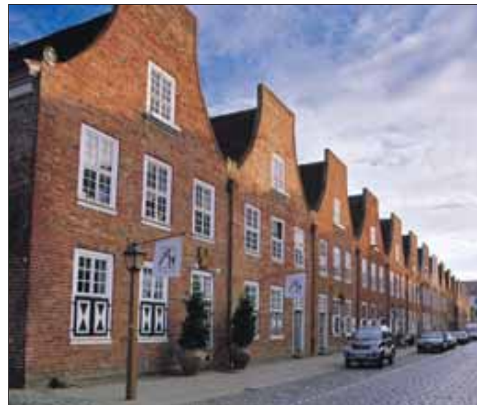
Das holländische Viertel