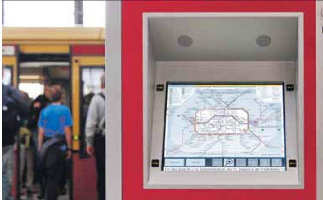
Ein integriertes Liniennetz komplettiert den Service an den neuen Fahrausweisautomaten.

Die neue Generation von Fahrausweisautomaten bei der S-Bahn Berlin kommt schneller als erwartet auf die Bahnhöfe. Vorgesehen ist, 400 bedienerfreundliche Geräte bereits bis Anfang Dezember in Betrieb zu nehmen. Das sind 100 Automaten mehr, als ursprünglich geplant. Derzeit sind 140 neue Fahrausweisautomaten auf 75 Bahnhöfen in Betrieb, damit verfügt fast die Hälfte aller Bahnhöfe bereits über die verbesserte Verkaufstechnik. Jede Woche kommen etwa 20 Ticketautomaten hinzu, die nun auch über ein integriertes Liniennetz verfügen. Zudem punkten die neuen Modelle durch eine einfachere Bedienung und ein besser lesbares Display.