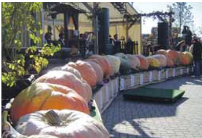
Welcher Kürbis ist der schwerste?

Mehr zum Streifzug des Monats in der nächsten punkt 3-Ausgabe.