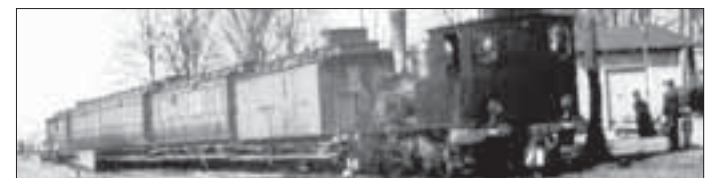
Zug im Bahnhof Rudow

67. Ausstellung des Rudower Heimatvereins e.V. „110 Jahre Neukölln-Mittenwalder-Eisenbahn“ 4.-26. September 2010, geöffnet Sa/So 10-16 Uhr; für Gruppen können gesonderte Termine vereinbart werden: Heimatverein@Rudow.de Dorfschule Rudow, Alt-Rudow 60