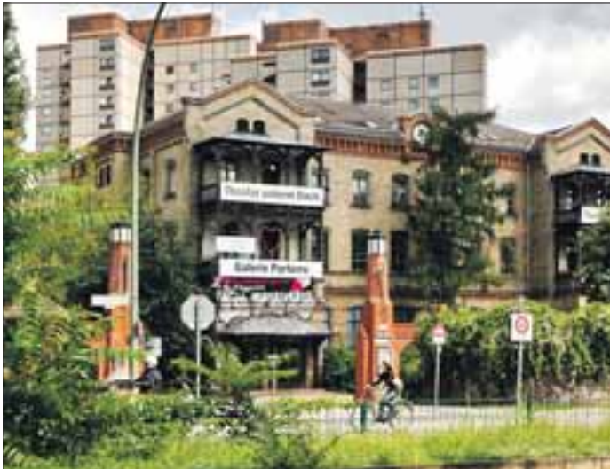
Gründerzeit trifft Plattenbau.

Als der Ringbahnhof Weißensee, der heute Greifswalder Straße heißt, 1875 eröffnet wurde, stand bereits ein beeindruckender Gebäudekomplex in unmittelbarer Nähe. Das riesige Betriebsgelände des Gaswerks IV mit den mächtigen gemauerten Gasometern zog ganz sicher den Blick der damaligen Ringbahn-Passagiere auf sich. Es sollte über 100 Jahre ein Wahrzeichen für diesen Kiez, den Prenzlauer Berg, bleiben.