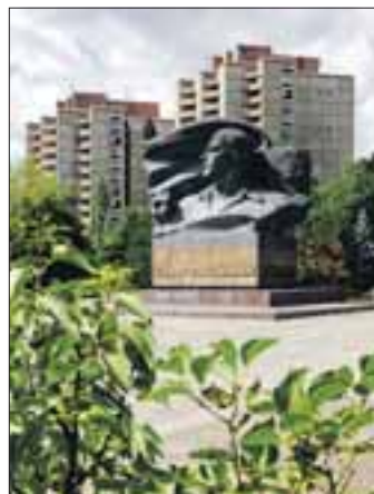
Der Thälmann-Park am ehemaligen Gaswerk-Standort

Als die Gasometer viel später, in den 1980er Jahren, zu Gunsten des Thälmann-Parks gesprengt wurden, waren die Proteste groß. Die Bauwerke wichen einem neuen Areal, das