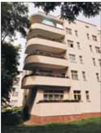
Die Wohnstadt „Carl Legien“ gehört zum Unesco-Welterbe.

Bereits in den 1920er Jahren entwarf Bruno Taut mit seiner Wohnsiedlung „Carl Legien“ an der Erich-Weinert-Straße einen modernen architektonischen Gegenentwurf zur üblichen Blockbauweise der Grün-