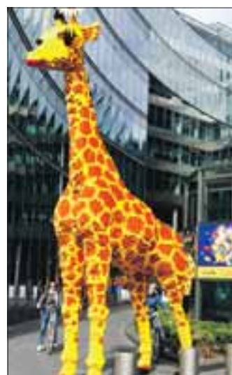
Am S-Bahn-Tag ins Legoland zum Spezialpreis fahren-Karten gibt es in allen S-Bahn-Kundenzentren.