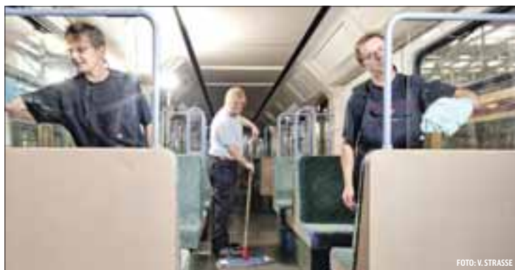
In den Werkstätten, wie hier in Grünau, sind werktags und an Wochenenden über 50 Reinigungskräfte beschäftigt.