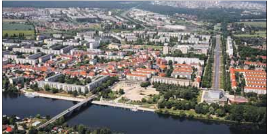
Die Stadt an der Hohensaaten-Friedrichsthaler Wasserstraße, dem alten Oder-Arm, aus Adler-Perpektive

Vier Festbereiche mit unendlich vielen Einzelveranstaltungen!