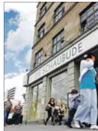
Die Schaubude lässt Puppen für Kinder und Erwachsene tanzen.

Auch weitere Adressen an der Greifswalder Straße stehen in der Kunst- und Kulturtradition des Kiezes. Das Puppentheater „Schaubude Berlin“ etwa, das als Figuren- und Objekttheater mit eigener Spielstätte und kontinuierlichem Kinder- und Abendspielplan einzigartig in Berlin ist. Und das unabhängige Theater „Eigenreich“ im denkmalgeschützten Haus der ehemaligen VEB Treffmodelle. Allerdings ist der Mietvertrag dieser Spielstätte im Rahmen des aktuellen Trends der Gegend – der Sanierung – gekündigt. Mit „60 Stunden Theater“, beginnend am 17. September um 12 Uhr, wird dem Haus und seiner Geschichte die „letzte“ Ehre erwiesen, bis am 19. September um Mitternacht die Pforten geschlossen werden. • Nina Dennert